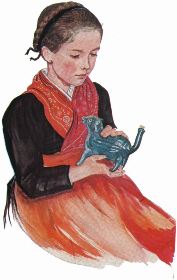
II. Mädchen aus dem Sarntal („Sarntaler Gitsch mit Schnapshund“). Aquarell-Tempera von Erna Moser-Piffli, um 1940 (Kat.-Nr. 63)