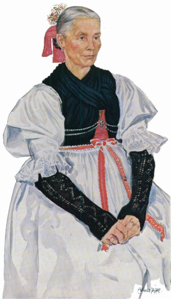
IV. Jungfrauen-Festtracht aus Klausen, Eisacktal („Barbara Unterthiener v. Star- ken Warbl, Gries bei Klausen 30“). Aquarell-Tempera von Erna Moser- Piffel, um 1940 (Kat.-Nr. 68)