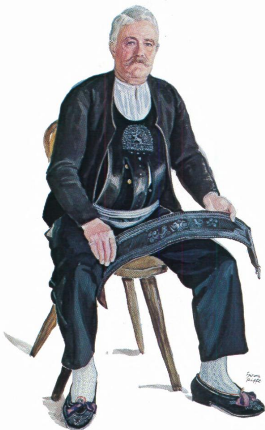
V. Sarntaler Bauer in Sonntagstracht („Der Hoferbauer, Durnholz 2“). Aquarell Tempera von Erna Moser-Piffel, um 1940 (Kat.-Nr. 101)