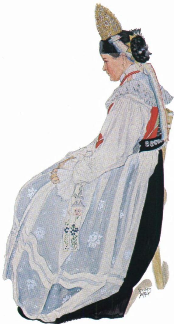
VII. Brautjungfer aus St. Christina („Erste Kranzjungfer bei der Hochzeit“). Aquarell-Tempera von Erna Moser-Piffel, um 1940 (Kat.-Nr. 194)