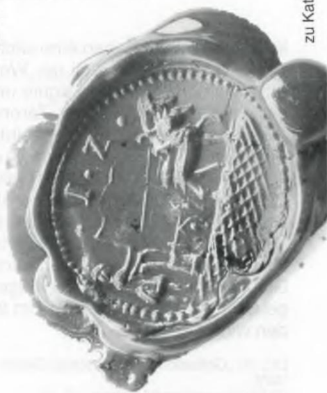
zu Kat.-Nr. 58