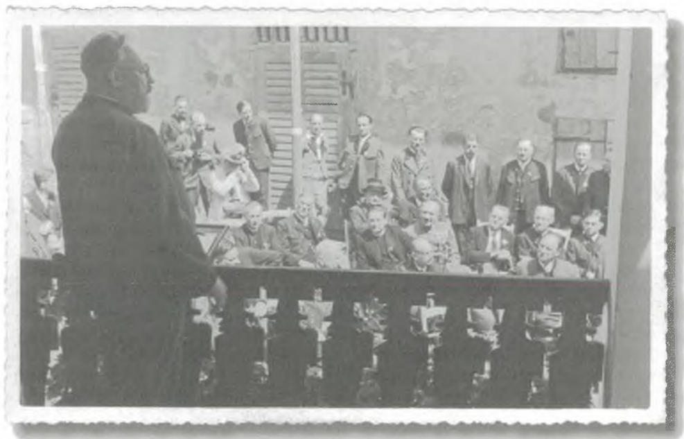
Viktor Geramb als Festredner bei der Grundsteinlegung zum Heimatsaaltrakt.

„Mutterboden“, den „vulgushaften“ Volksschichten beziehen. Deshalb kritisiert Geramb des Öfteren Indikatoren einer ungeliebten Modernisierung, wie den „ Weißer-Rössl-Kitsch “ und „ gschnasige Entartungen“ 306 , die Film-, Revue- und Spielbankenszene 307 sowie die „ Bar- und Nachtlokal-Kultur “ 308 , allgemeiner das Hyper-Intellektuelle 309 , als Metapher der Moderne das Städtische 310 , das Mondäne und Internationale, oder, skurrilerweise als Indikator für all dies Ungeliebte, das Saxophon (!) 311 . Beispielsweise in der Korrespondenz mit Leopold Schmidt 312 taucht Gerambs Kritik an ungeliebten Zeiterscheinungen (neue Medien, Unterhaltung ...) hier allerdings erst nach dem Zweiten Weltkrieg, in Verbindung mit der Besatzungszeit, auf. 313