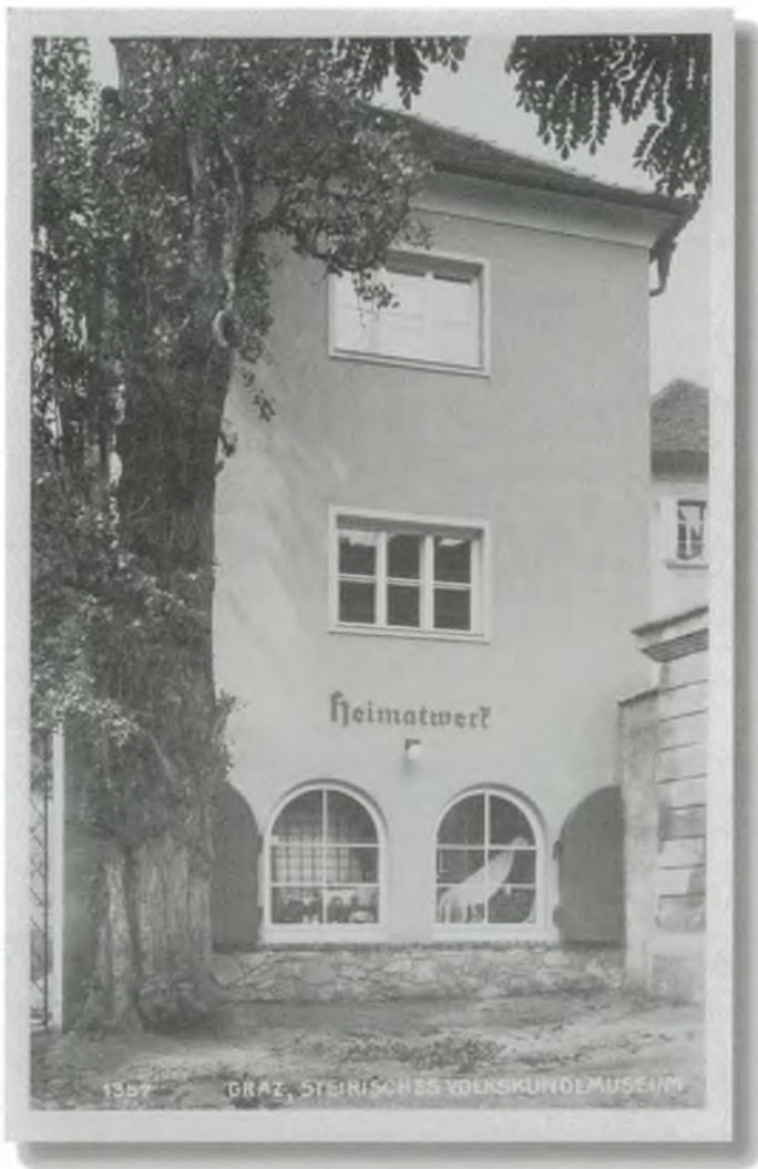
Das „Heimatwerk des Steirischen Volkskundemuseums“, 1934 als erstes Heimatwerk in Österreich eröffnet, war ursprünglich im „Stöckl“, einem turmartigen Gebäude, neben dem Museum untergebracht. Foto: Steffen, Graz, vor 1937

Verwendung der Produkte, z. B. das Tragen „echter“ Volkstracht, soll heimatische Kulturpflege angeregt und über diese die Bewahrung im Aussterben begriffener kunsthandwerklicher Fertigkeiten und letztlich einer sich wandelnden ländlichen Kultur erreicht werden. Geramb schreibt über den Sinn und Zweck des Heimatwerkes: