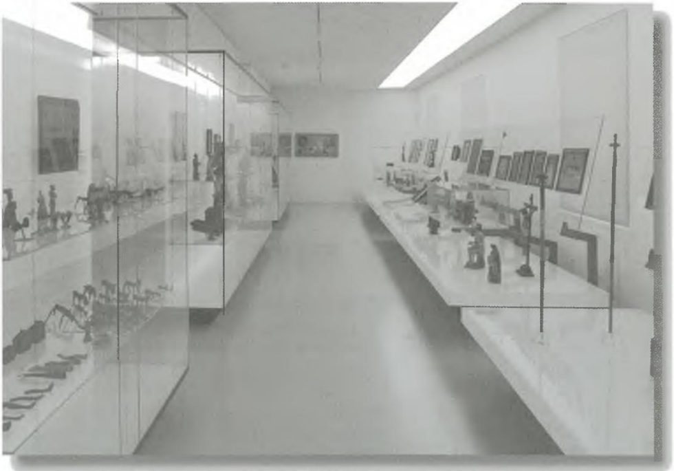
Ein Blick in den Bereich „Ritual und Glaube“ der 2003 neu gestalteten Schausammlung des Volkskundemuseums.

Mit dem Beginn des Ersten Weltkrieges am 1. August 1918 ist an eine kontinuierliche museale Aufbau- und Ausbautätigkeit nicht mehr zu denken. Obwohl Geramb, angesteckt von der anfangs weit verbreiteten Kriegsbegeisterung, gerne gemeinsam mit seinen Freunden und Kollegen ins Feld ziehen möchte, bewahrt ihn seine Sehbehinderung vor dem Kriegsdienst-einsatz. 88 Geramb engagiert sich allerdings beim Roten Kreuz, hilft zwei Sanitätskolonnen für Polen auszurüsten und arbeitet „1916 bei der Metall-ablieferungskommission in Obersteier“ 89 . Mit der Unterstützung des Vereines für Heimatschutz und im Auftrag des damaligen Statthalters Manfred Graf Clary-Aldringen gibt Geramb weiters die „Heimatgrüße“ für steirische Soldaten „und die Schrift über steirische Kriegerdenkmäler heraus“ 90 .