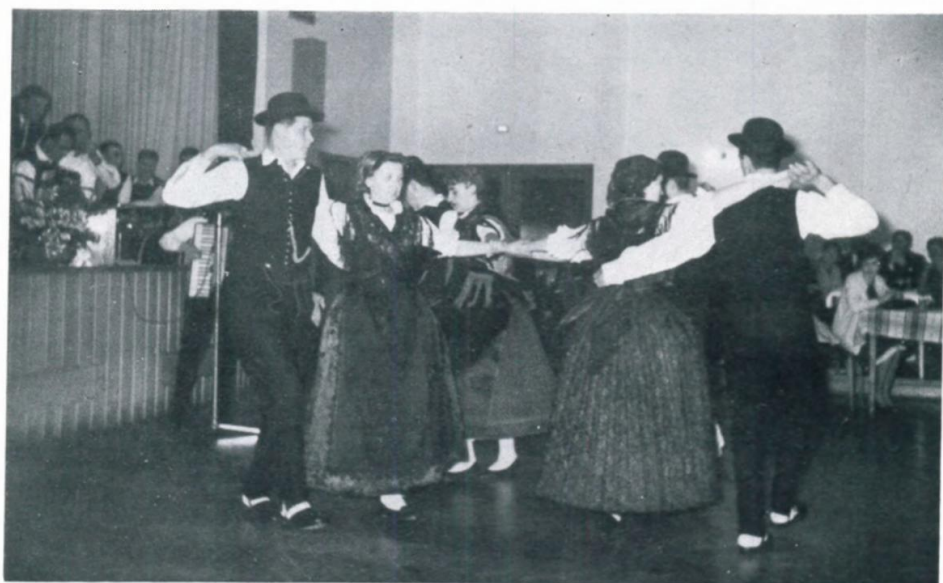
22. Schwabenball in Linz, 1962