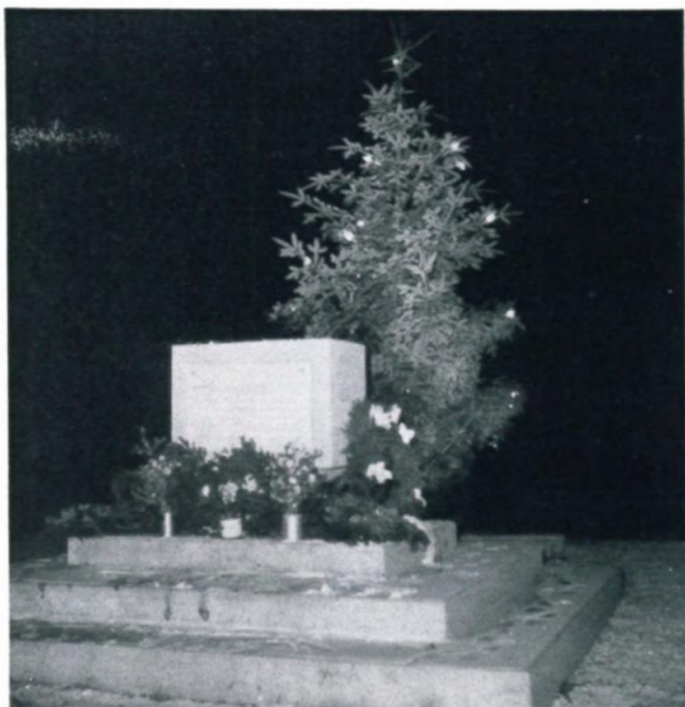
7. Ehrenmal mit Christbaum