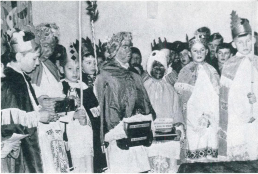
15. Dreikönigssänger aus der Siedlung Langholzfeld, 1962