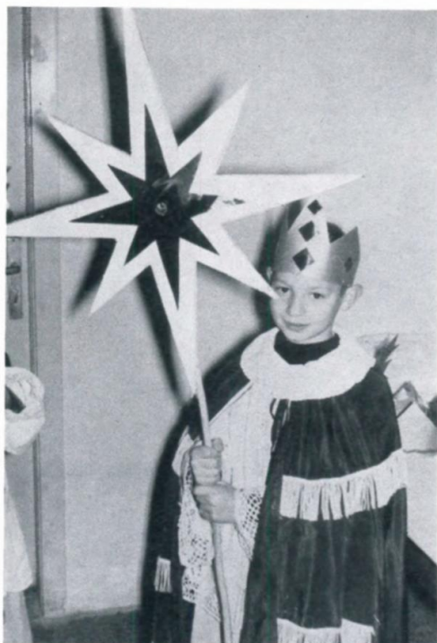
18. Sternsinger aus der Siedlung Langholzfeld