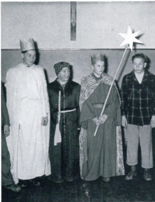
20. Sternsinger im Lager