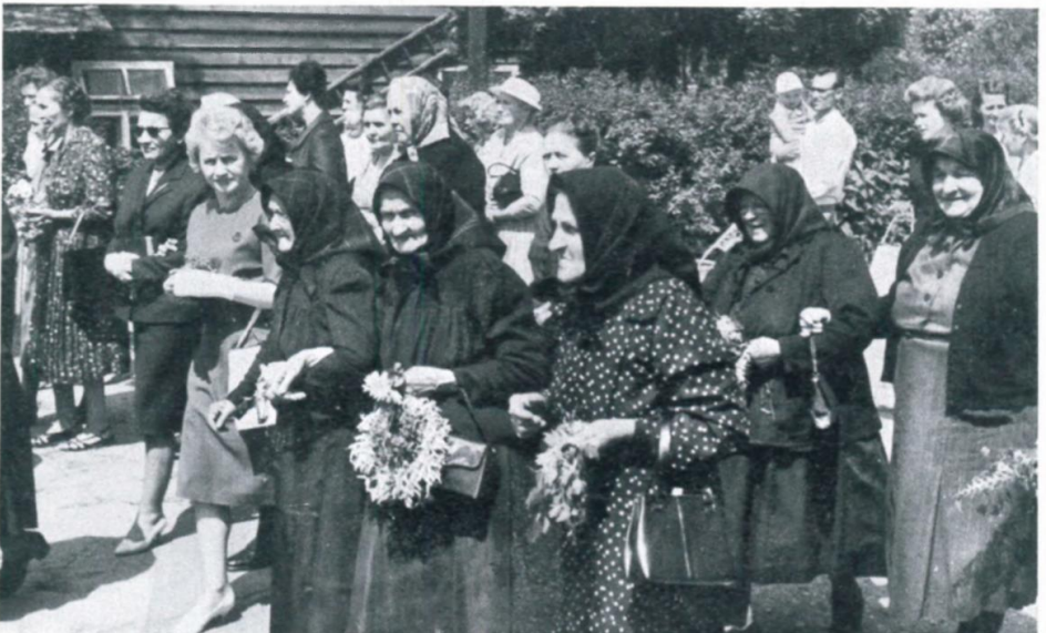
30. Fronleichnamsprozession 1961