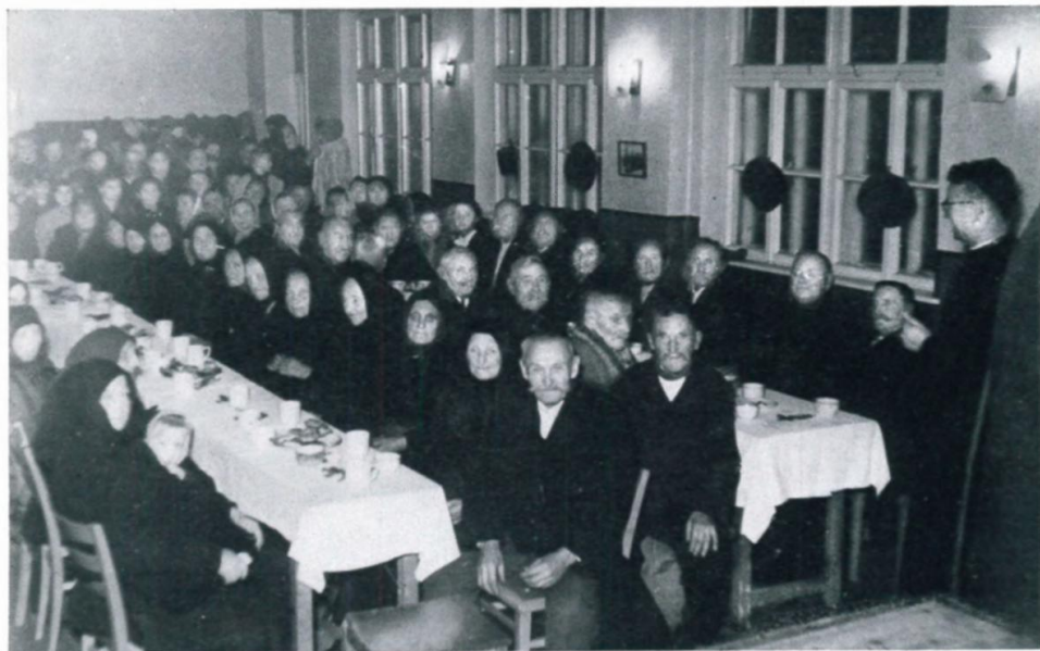
8. Altenehrung im Lager Haid, 1954