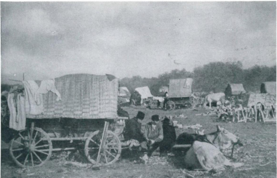
2. Rast der Heimatvertriebenen mit ihren bäuerlichen Gespannen