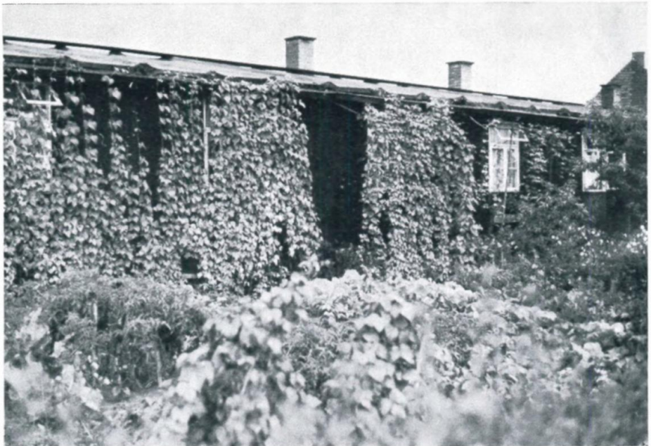
4. Bohnen und Wicken an den Baracken