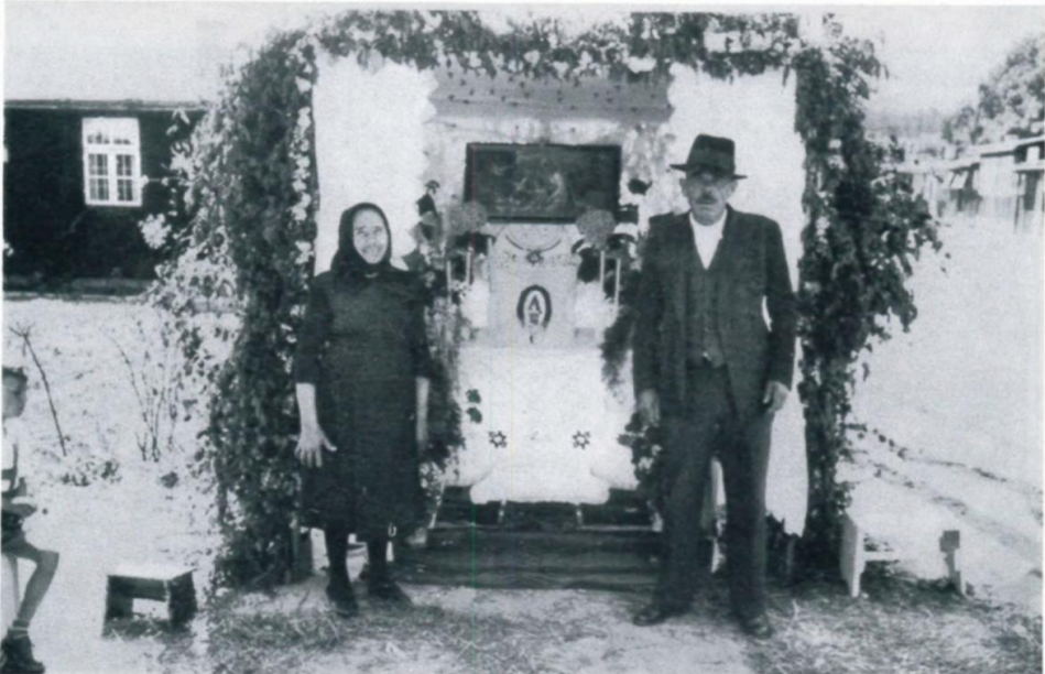
28. Fronleichnamsaltar im Lager