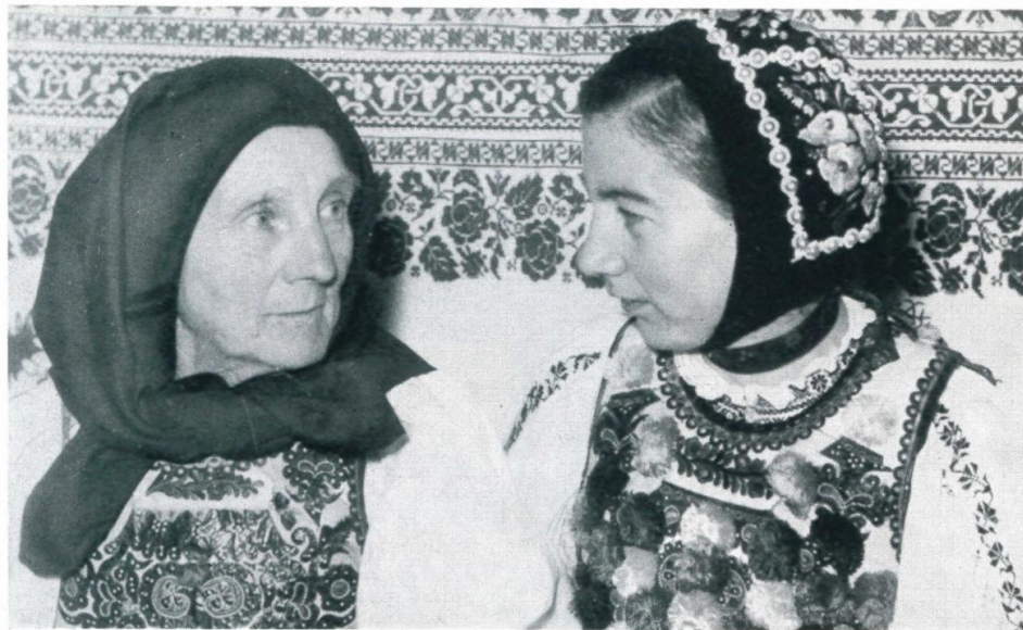
5. Siebenbürgische Frauen- und Mädchentrachten