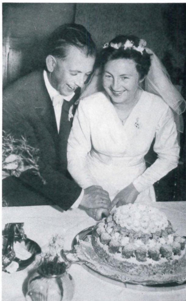
50. Hochzeit im Lager 65, Brauttorte mit Rosmarinweig