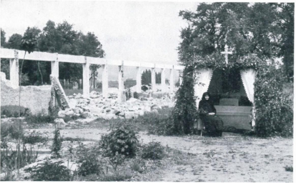
29. Fronleichnamsaltar in dem bereits im Abbruch befindlichen Lager 65, Linz 1961