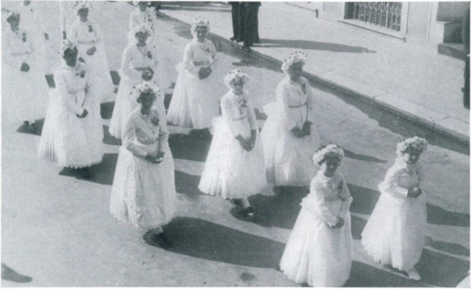
23. „Muttergottesmädel“ zu Fronleichnam