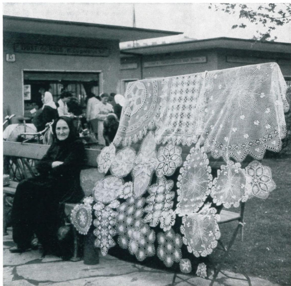
6. Siebenbürgische Zierdecken-Verkäuferin