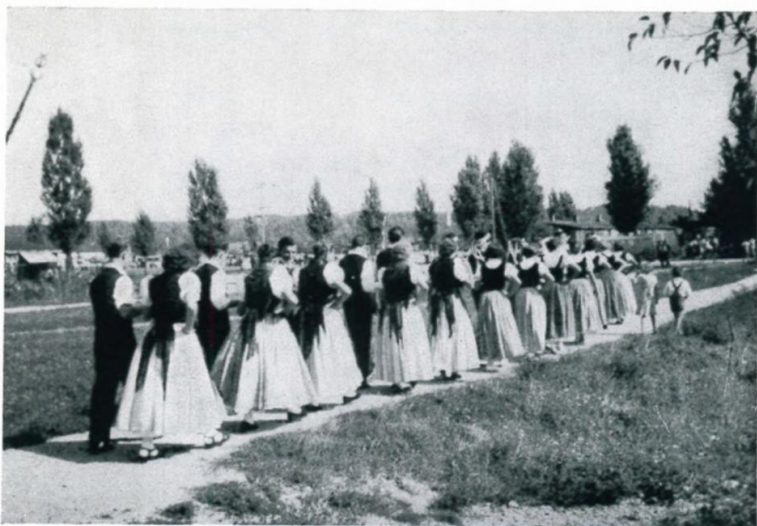
53. Historische Trachten bei Festzug im Lager Haid