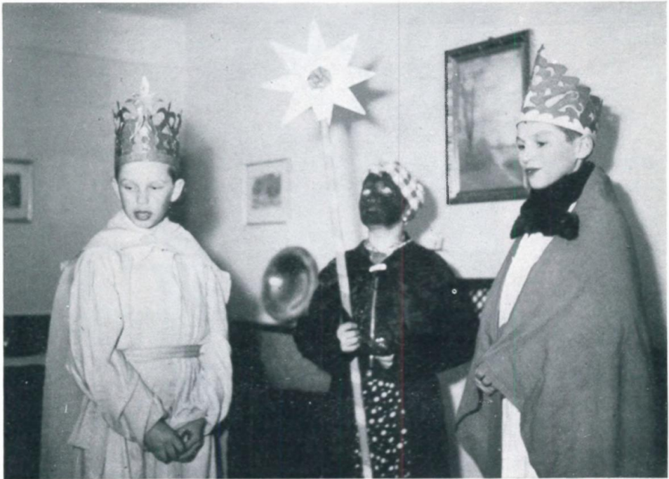
16. Sternsinger aus der Siedlung Langholzfeld