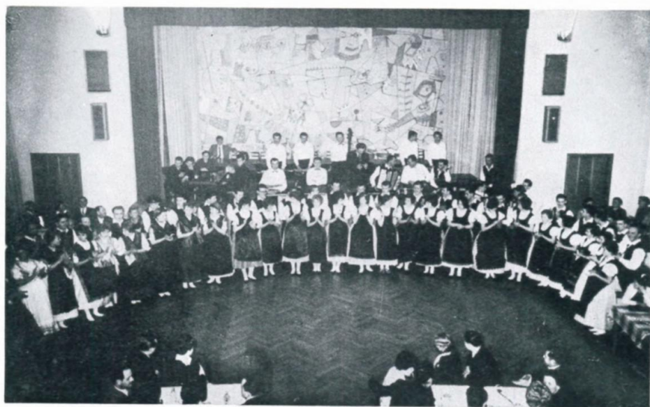
21. Schwabenball in Linz, 1962, Ballbeginn