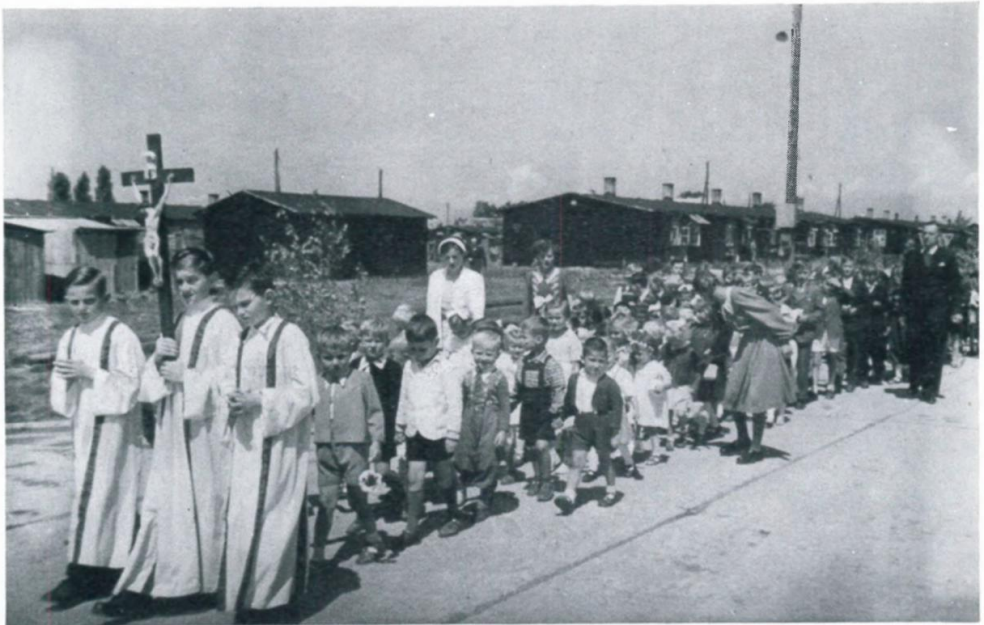
24. Fronleichnamsprozession im Lager