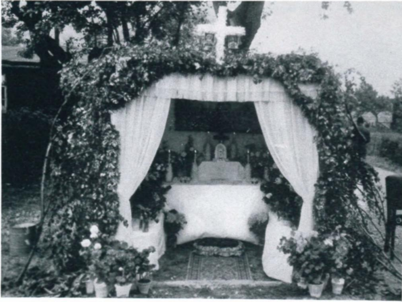
27. Fronleichnamsaltar im Lager