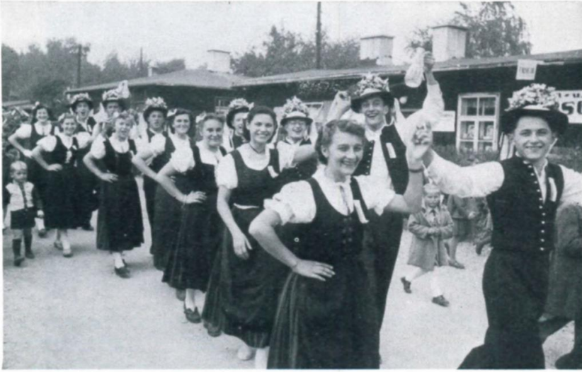
38. Kirchweihzug der jungen Paare