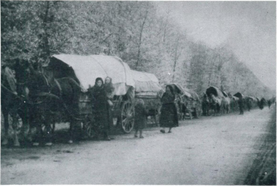
1. Heimatvertriebene Deutsche auf dem Weg nach Österreich