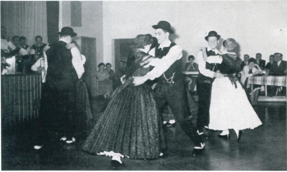
51. Hochzeitstanz in alten Trachten