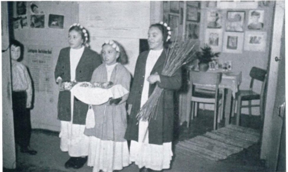
45. Weihnachtsspiel im Lager Haid