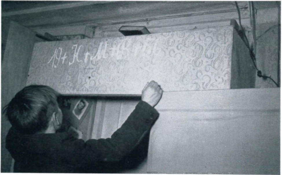
19. Anschreiben des Dreikönigssegens im Lager