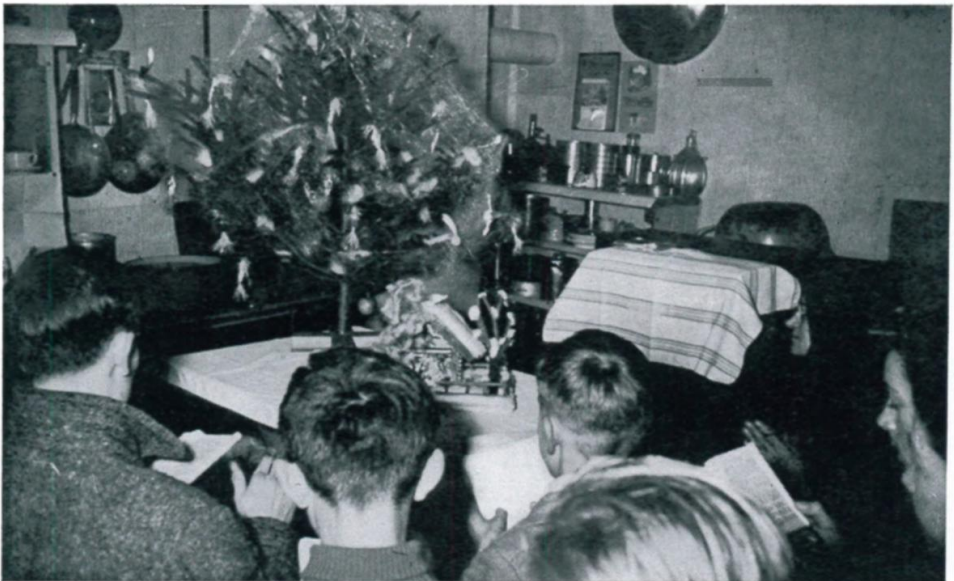
43. Christbaumfeier im Lager