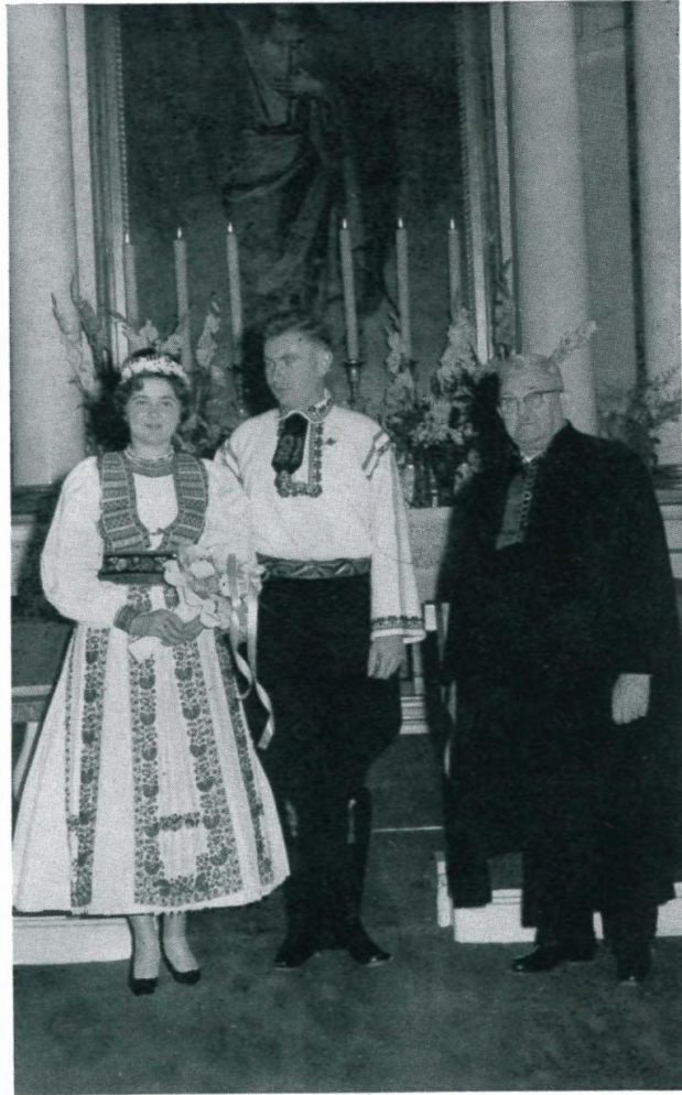
47. Siebenbürger Sachsen-Hochzeit mit Heimatpfarrer