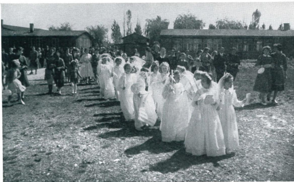
13. Erstkommunikanten im Lager Haid