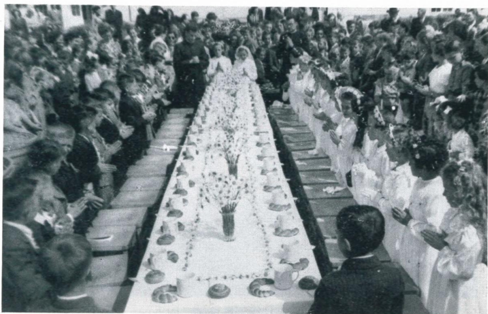
11. Jause für die Erstkommunikanten im Lager Haid