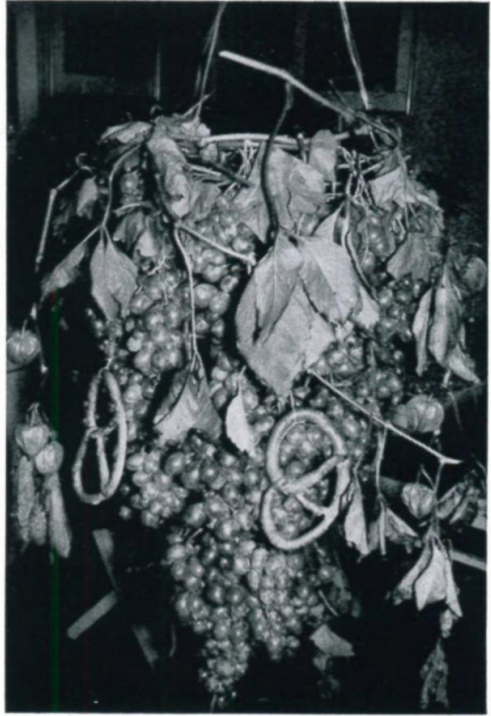
40. Riesentraube im Lager 65