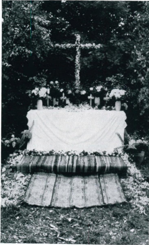
31. Fronleichnamssaltar Lager Langholzfeld 1960