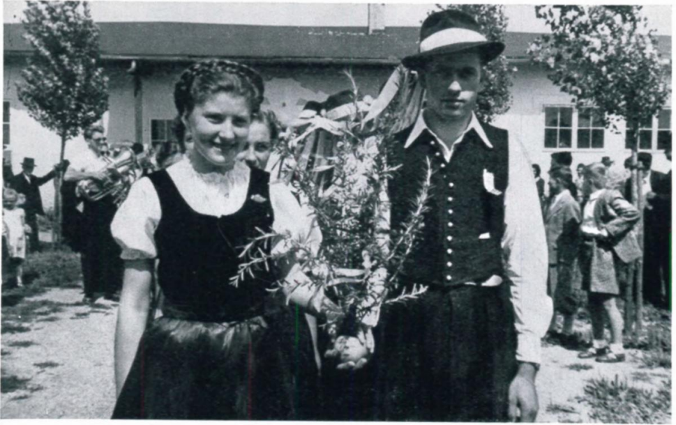
37. Kirchweihstrauß im Lager Haid