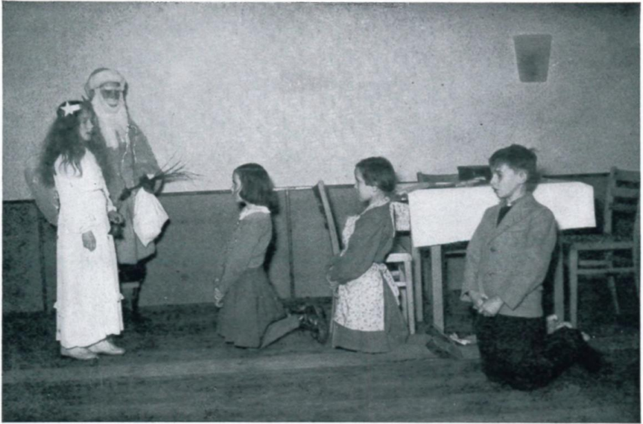
42. Einkehrspiel mit Christkind und Weihnachtsmann