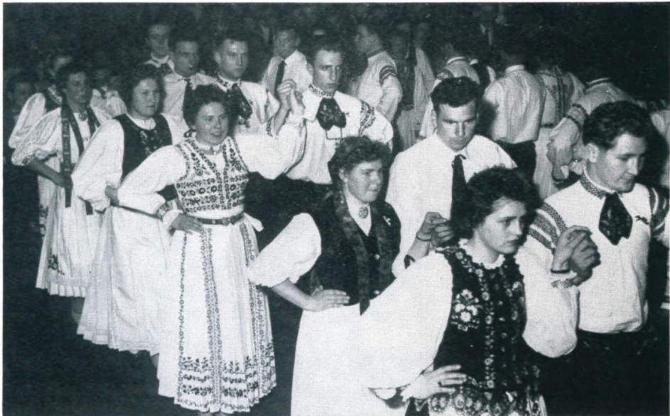
52. Auftanz der Siebenbürger Sachsen