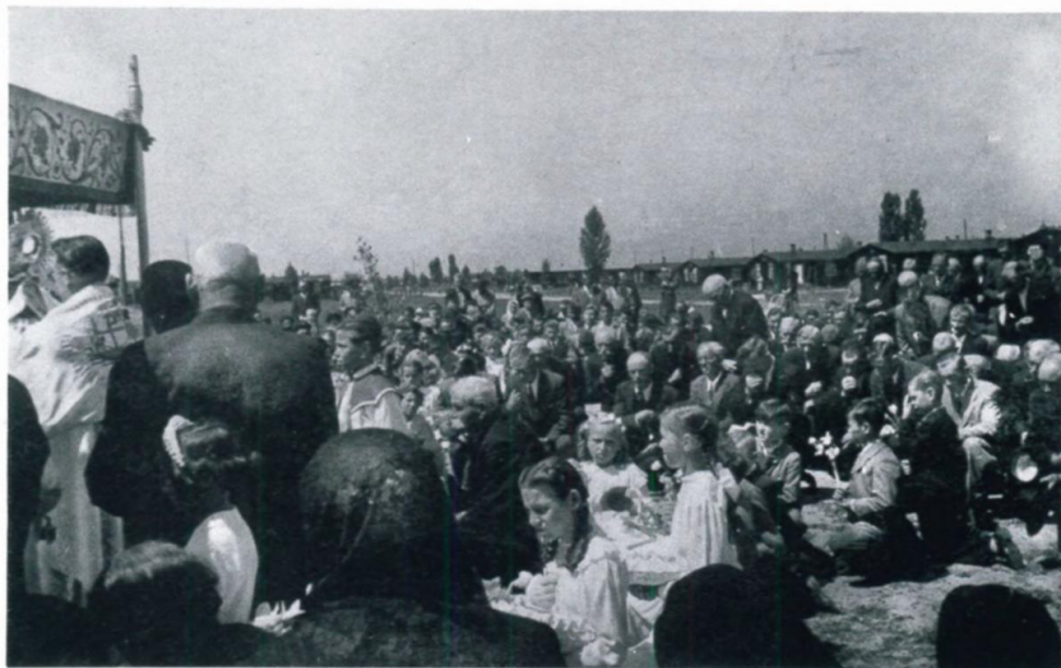
26. Segnung bei der Fronleichnamsprozession