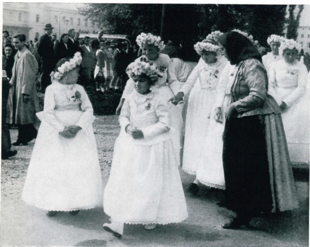
54. Mädchen in Prozessionstracht