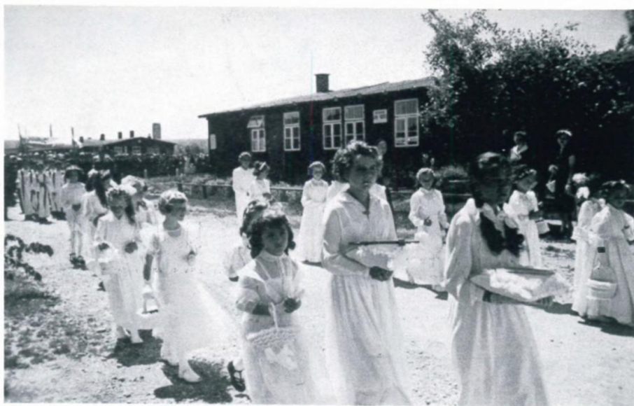
25. Mädchen in der Fronleichnamsprozession