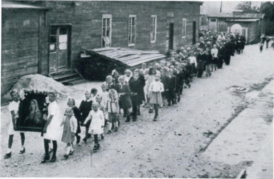
34. Prozession zu Maria Himmelfahrt mit einem geschmückten Marienbild, Lager 55