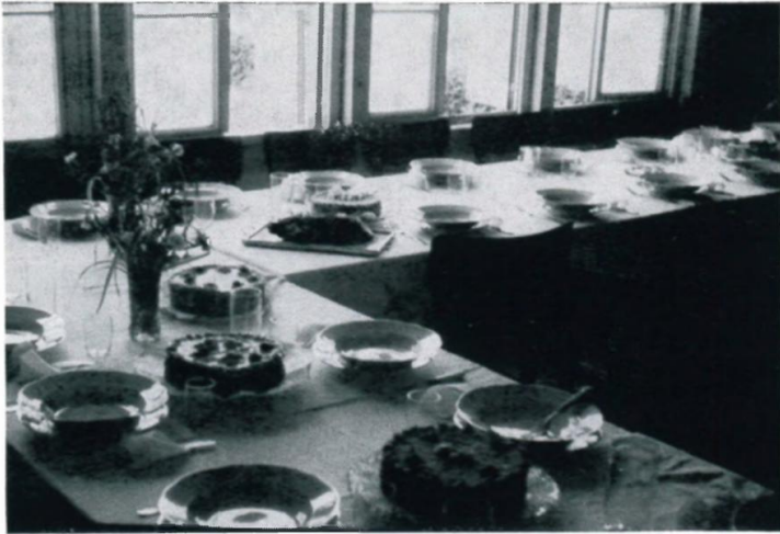
48. Hochzeitstafel im Lagersaal, Lager 65