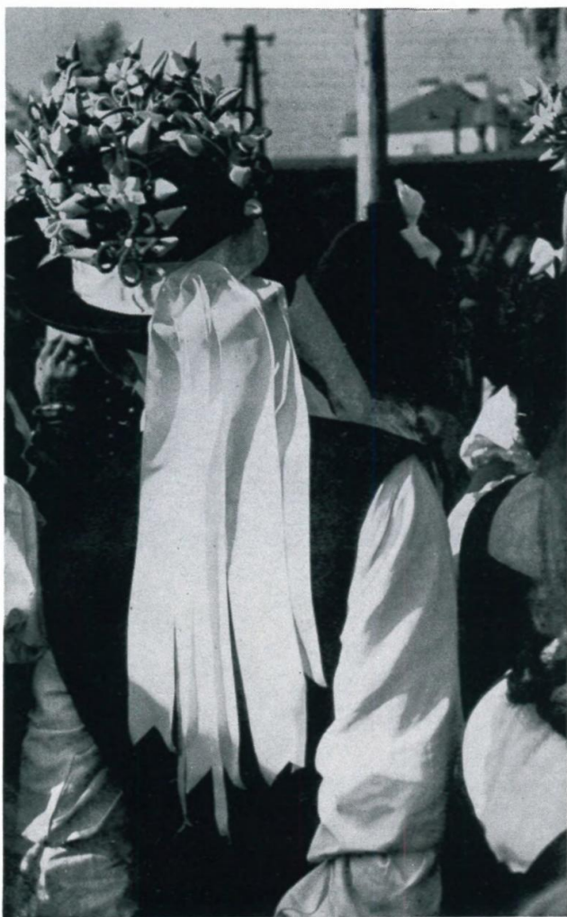
36. Kirchwaihertracht im Lager 65