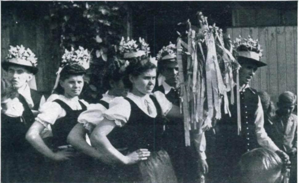
39. Junge Paare mit dem Kirchweihstrauß