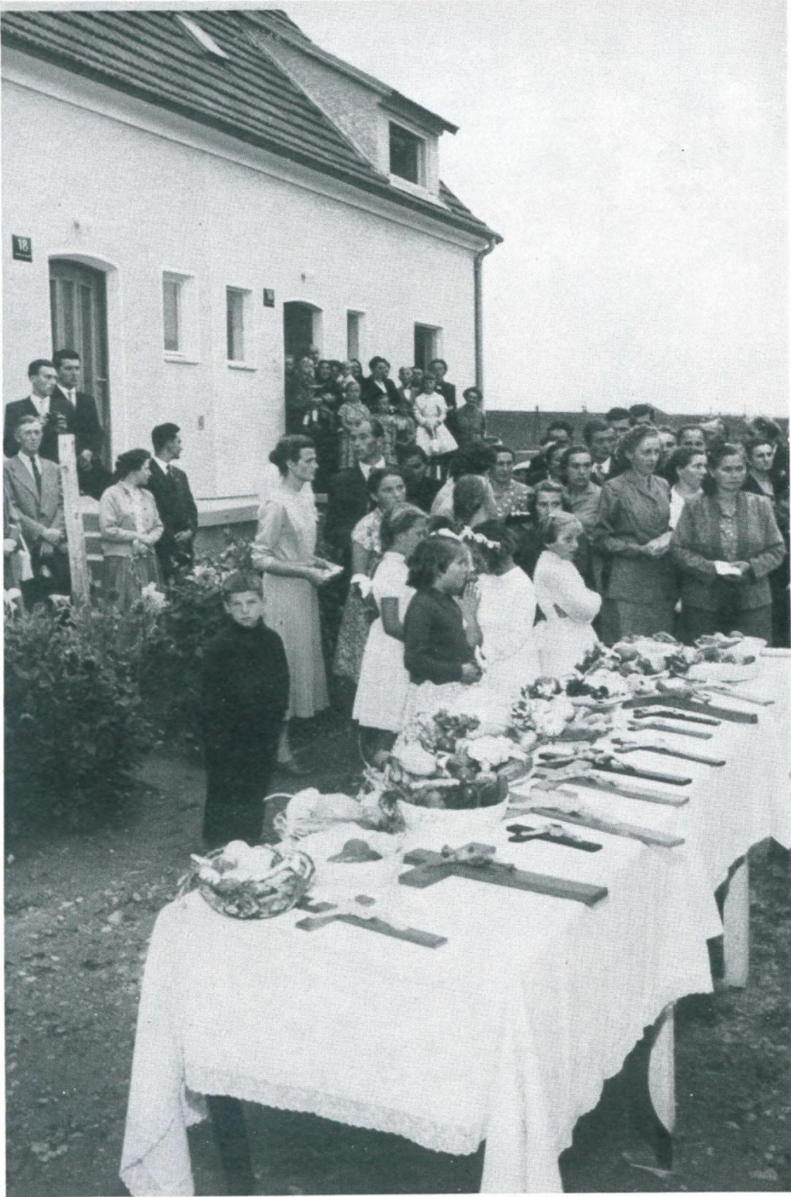
10. Weihe der Früchte und Hauskreuze