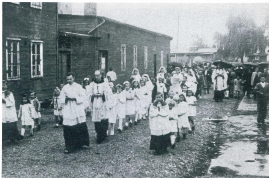
12. Zug der Erstkommunikanten im Lager 55