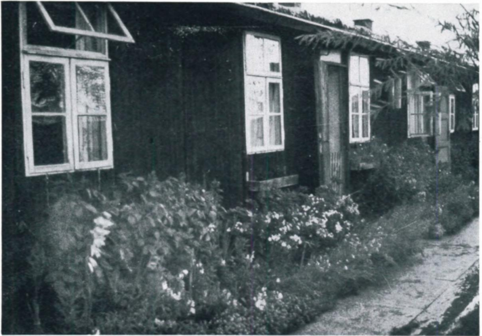
3. Blumen an den Barackenwänden um Linz