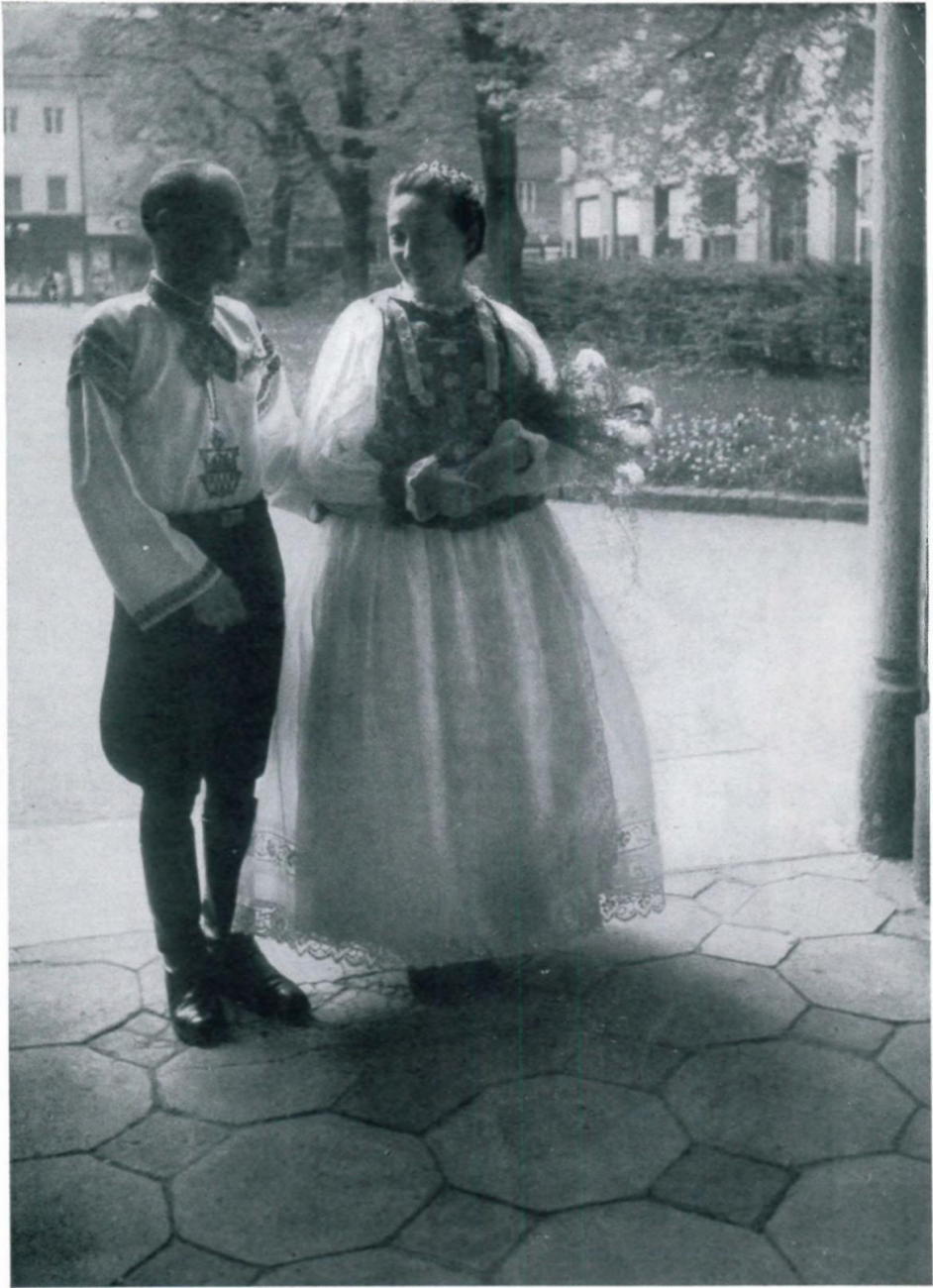
46. Siebenbürger Sachsen-Hochzeit