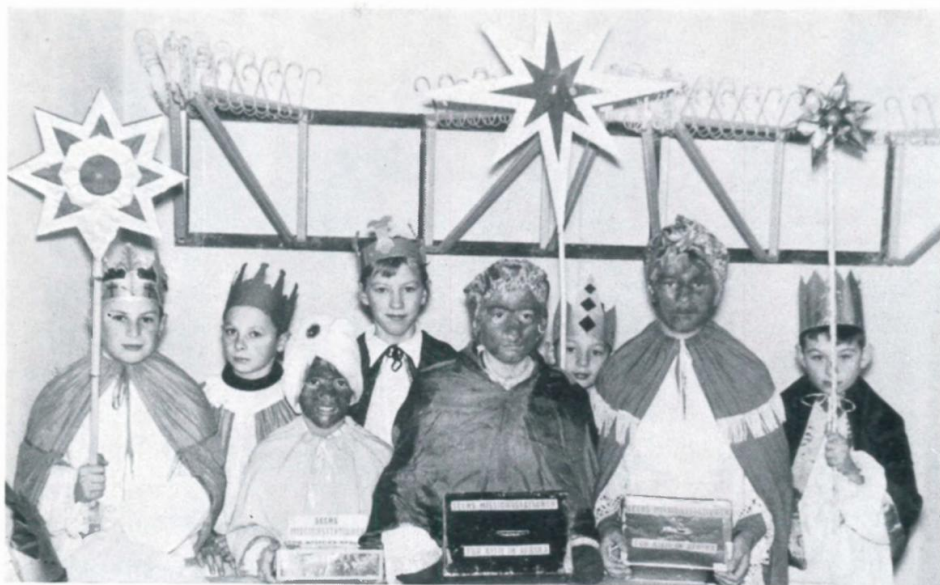
17. Sternsinger aus der Siedlung Langholzfeld