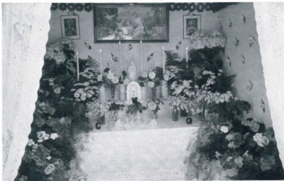
33. Inneres eines Fronleichnamsaltares im Lager 65