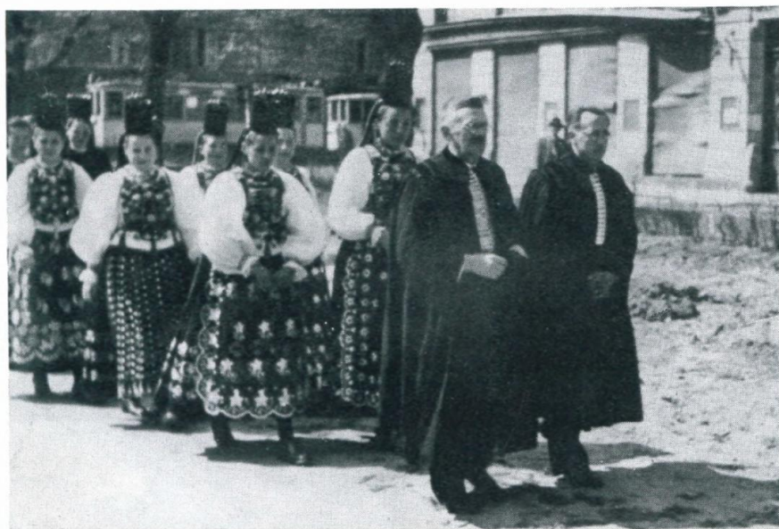
14. Konfirmation der Siebenbürger Sachsen in Linz, Ostern 1946