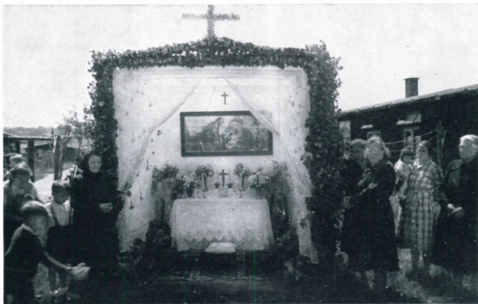
32. Fronleichnamsaltar im Lager 65