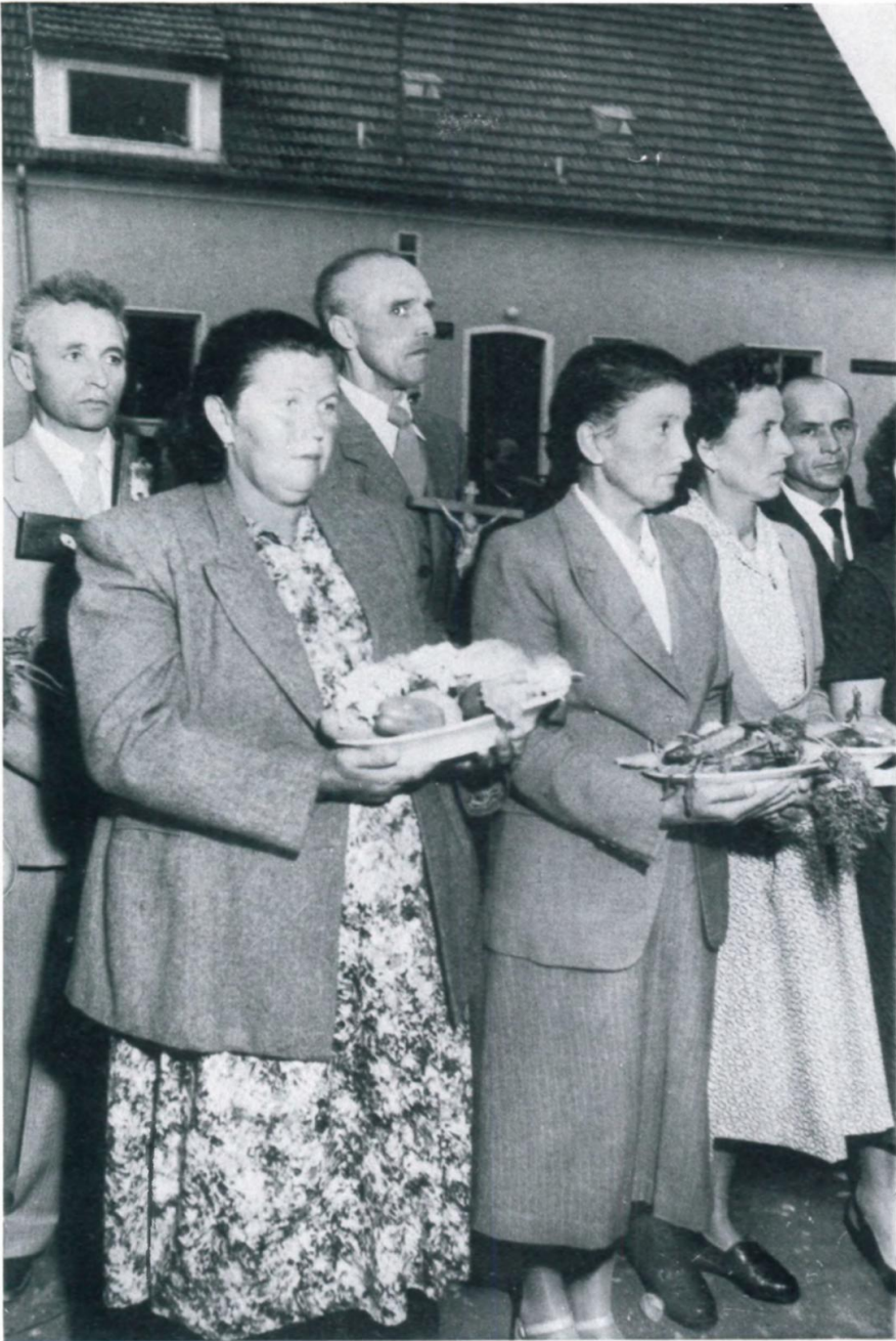
9. Weihe der Früchte und Kreuze in der Werrenfried-Siedlung