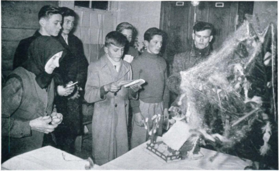
44. Weihnachtsfeier im Lager