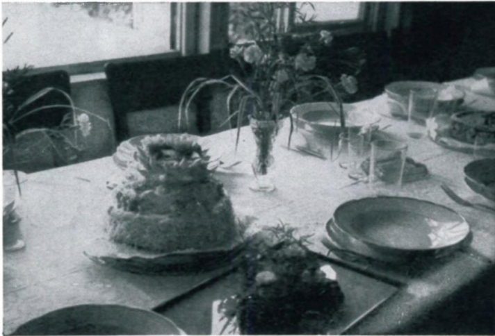
49. Hochzeitstorte auf der Tafel im Lager 65