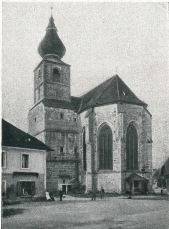
Die Wallfahrtskirche Adlwang