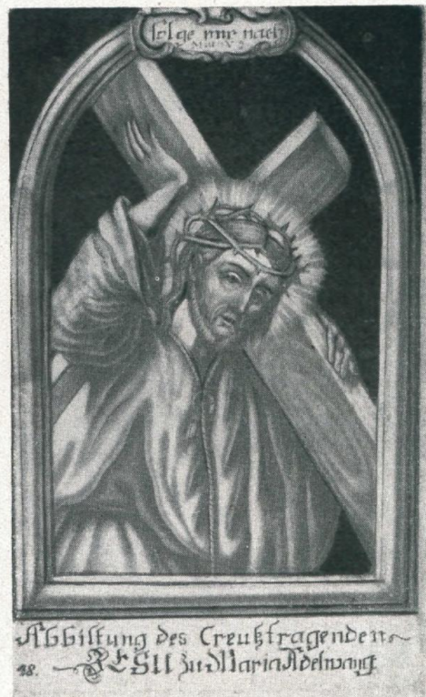
Das wundertätige Christusbild in Adlwang