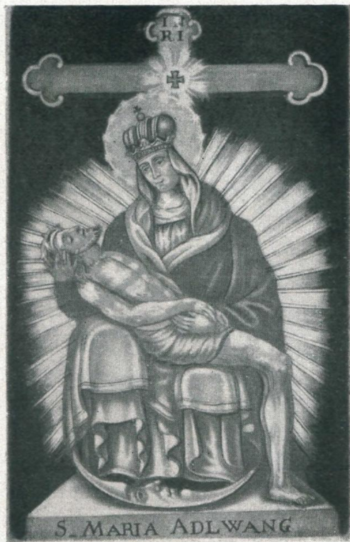
Das wundertätige Vesperbild in Adlwang